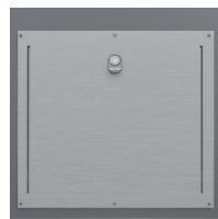
Trappe Gros Producteur