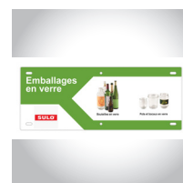
Consignes De Tri (exemple)