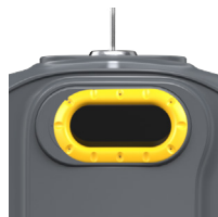
Emballage Jaune Zinc RAL 1018