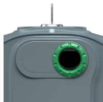
Verre Vert RAL 6010-6018