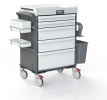
OP-920-QUARTZ QUARTZ COULEUR QUARTZ POUR MOBILIER TECHNIQUE