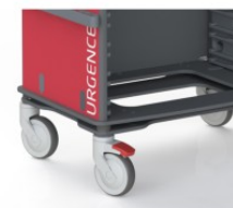
OP-ID STICKER IDENTIFICATION PERSONNALISABLE - EN OPTION STICKER IDENTIFICATION PERSONNALISABLE - EN OPTION