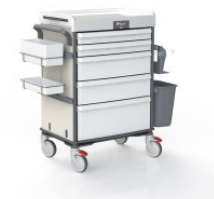
OP-920-JASMINA JASMINA COULEUR JASMINA POUR MOBILIER TECHNIQUE