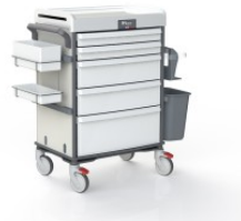
OP-920-RICE-PAPER RICE PAPER COULEUR RICE PAPER POUR MOBILIER TECHNIQUE