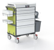
OP-920-LIMON LIMON COULEUR LIMON POUR MOBILIER TECHNIQUE