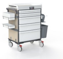
OP-920-ATLAS-OAK ATLAS OAK COULEUR ATLAS OAK POUR MOBILIER TECHNIQUE