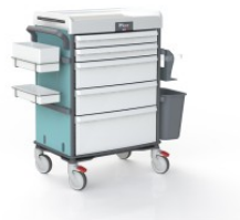
OP-920-EXOTIQUE-BLEU EXOTIQUE BLEU COULEUR EXOTIQUE BLEU POUR MOBILIER TECHNIQUE