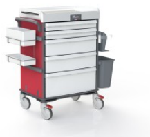
OP-920-RED-CANDY RED CANDY COULEUR RED CANDY POUR MOBILIER TECHNIQUE