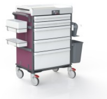
OP-920-PLUM-PURPLE PLUM PURPLE COULEUR PLUM PURPLE POUR MOBILIER TECHNIQUE