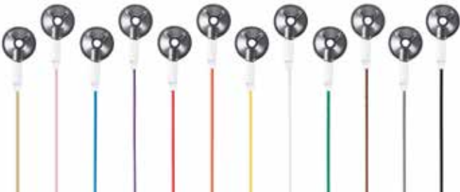
12 couleurs de câble