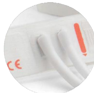
Nouveau-Né Brassard jetable Deux tubes