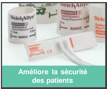
Améliore la sécurité des patients