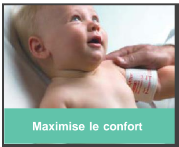
Maximise le confort