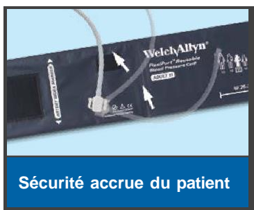
Sécurité accrue du patient

Abordables et faciles à utiliser, les brassards réutilisables FlexiPort Welch Allyn offrent tous les avantages de la technologie FlexiPort – incluant la simplicité de connexion – avec une conception durable et fiable.