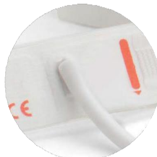
Nouveau-Né Brassard jetable Un tube