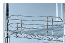
CÔTÉ ÉTAGÈRE L.457 mm RÉF. : 374.635B L.610 mm RÉF. : 374.637B