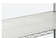
PLAQUE PVC RÉF. : Voir page 41.