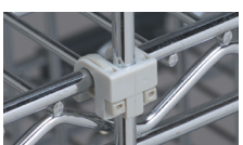
CROCHET NYLON DE FIXATION RÉF. : 374.663B