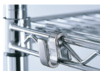
CROCHET DE LIAISON RÉF. : 374.655B TIGE DE RETENUE RÉF. : 374.671B