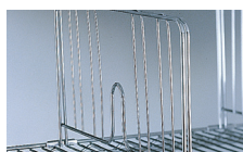
SÉPARATION D'ÉTAGÈRES L. 457 mm RÉF. : 374.631B L. 610 mm RÉF. : 374.633B