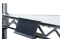
PORTE-ÉTIQUETTE RÉF. : 374.657B