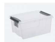
CAISSE PLASTIQUE Petite L.390 x L.290 x H.185 mm. RÉF. : 371.009