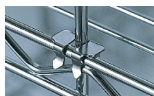
CROCHET DE FIXATION RÉF. : 374.653B