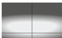
Répartition lumineuse elliptique