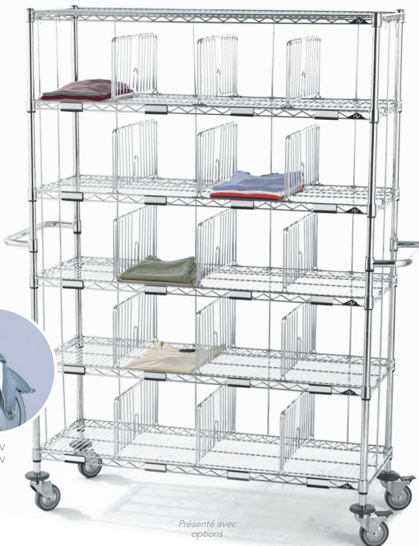
SYSTÈME DE FIXATION EXCLUSIF SCLESSIN