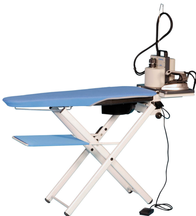
Table à repasser pliante avec chaudière PLIA-DOMINA