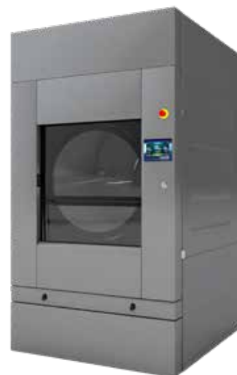
Porte coulissante automatique