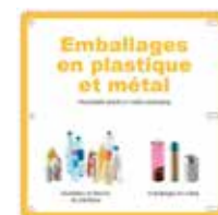
Consignes De Tri (exemple)