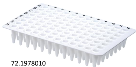
72.1978010 Sans jupe