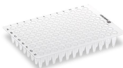
72.1978 Sans jupe