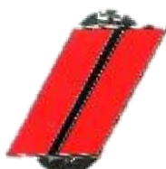
CAPORAL 2 bandes Rouge / 1 bande Noire Réf: 040591