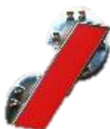
SAPEUR 1 ÈRE CLASSE Rouge Réf : 040590