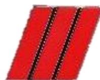
CAPORAL CHEF 3 bandes Rouge/ 2 bandes Noires Réf : 040592