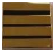
COMMANDANT MEDECIN ET PHARMACIEN 4 bandes Or/ 3 bandes noires Réf : 040607