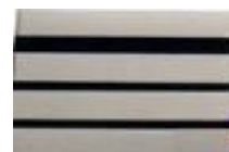
COMMANDANT VÉTÉRINAIRE COMMANDANT CADRE DE SANTÉ 1 ère classe 4 bandes Argent/ 3 bandes noires Réf : 040600