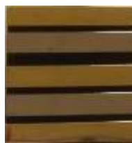
LIEUTENANT COLONEL MEDECIN ET PHARMACIEN 1 er , 3 ème , 5 ème bande Or/ 2 et 4 è bande Argent/ 4 bandes noires Réf : 040608