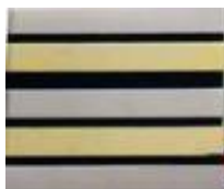
LIEUTENANT COLONEL VÉTÉRINAIRE LIEUTENANT COLONEL CADRE SUPÉRIEUR DE SANTÉ 1 er , 3 ème , 5 ème bde Argent/ 2 et 4 ème bande Or/ 4 bandes noires Réf : 040601