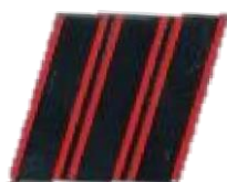
SERGENT CHEF Rouge/ argent Réf : 040594