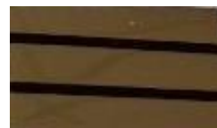
MEDECIN CAPITAINE PHARMACIEN CAPITAINE 3 bandes Or/ 2 bandes noires Réf : 048795