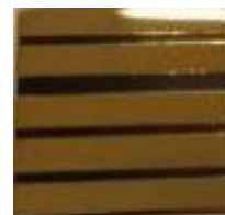
COLONEL MEDECIN ET PHARMACIEN 5 bandes Or/ 4 bandes noires Réf : 040609