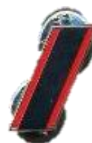
SERGENT Rouge/ argent Réf : 040593