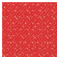
Tissu aramide renforcé