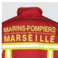
Ajout identification dos de la veste (minimum de 20 vestes)