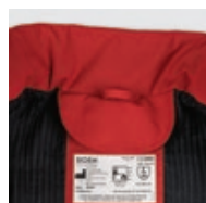
Demi-lune de marquage, code barre et bride d'accrochage