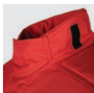
Velcro de fixation de la patte de col