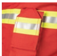
Poche radio avec rabat permettant passage de l'antenne