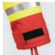
Bas de manche avec serrage et bord-côte avec passe pouce