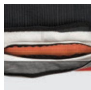
Double trappe de visite