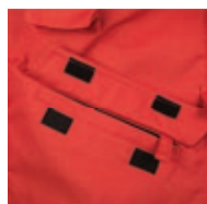
Rabat de poche fermé par deux auto-agrippants