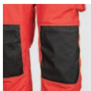
Renforts genoux en Kevlar® enduit