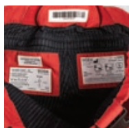
Bride d'accrochage, étiquette & code-barres