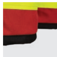
Ourlet bas de jambe renforcé