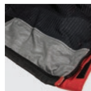
Bande anti- remontée d'eau