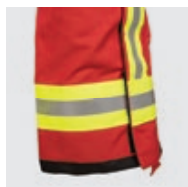
Ouverture latérale sous rabat