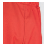
Sur-pantalon sans ouverture ni braguette