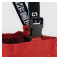
Boucle de fixation des bretelles