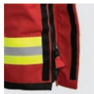
Glissière avec patte de préhension