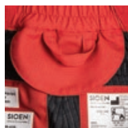
Demi-lune de marquage