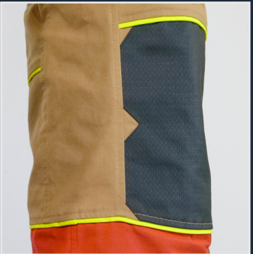
Passepoil jaune fluo