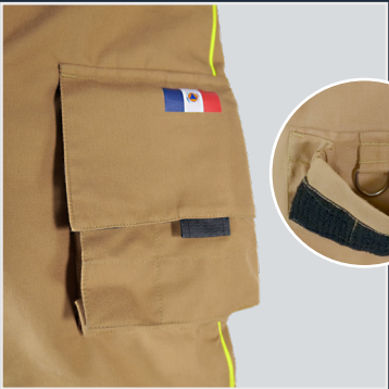
Poche cuisse avec anneau D interne