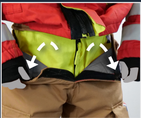
Dispositif d'assemblage des 2 coques