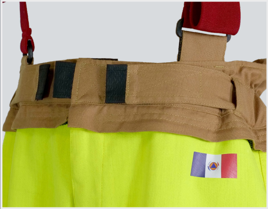
Système serrage taille (élastique et pattes de serrage)