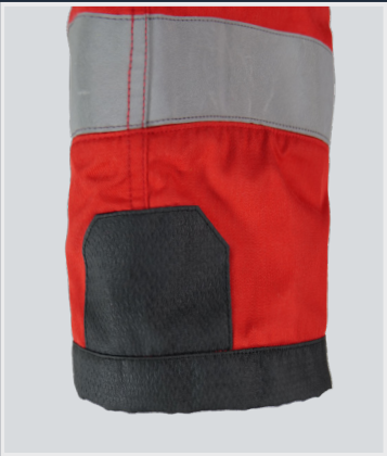
Renfort malléole et ourlet