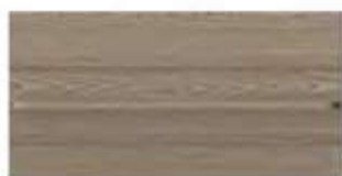
Etagère simple 74-0653 65x15x50 cm 8 kg