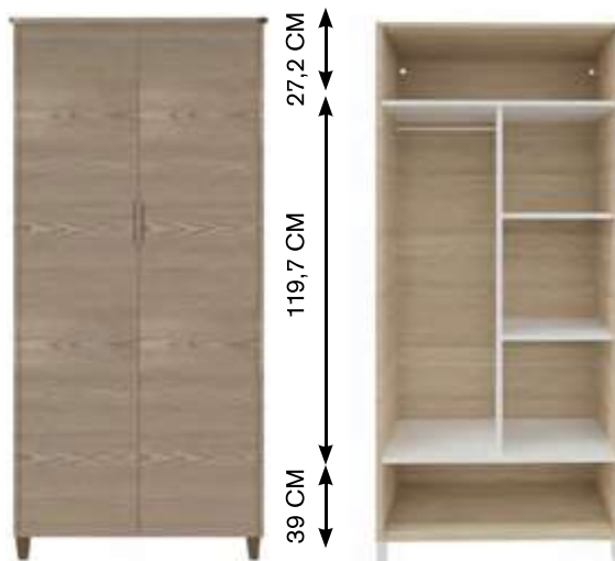
Armoire 2 portes 74-0555M 90x56x190 cm 108 kg