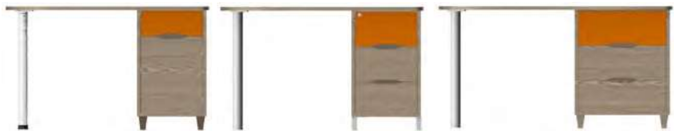
bureau-commode 120 cm 74-0458M 120x48x75 cm 49 kg