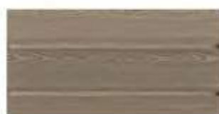
Etagère double 74-0654 65x15x50 cm 10 kg