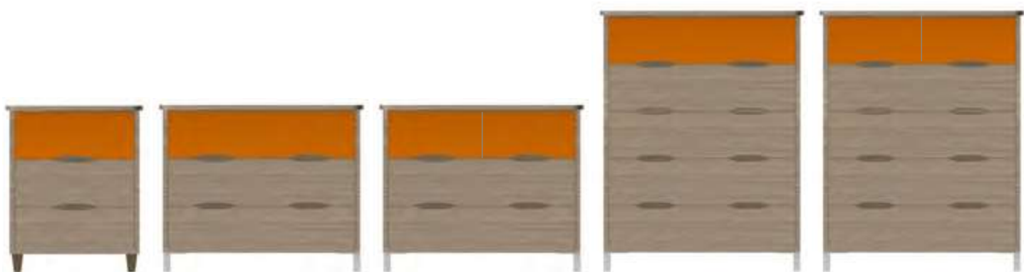
commode 60 cm 74-0360M 60x57x74 cm 49,5 kg