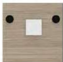
Porte-manteau 74-0661 20x20 cm 2 kg