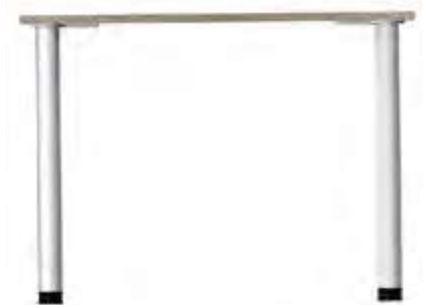
Table de chambre 4 pieds métal 74-0254M - 80x55x75 cm - 10 kg 74-0255M - 100x55x75 cm - 12 kg