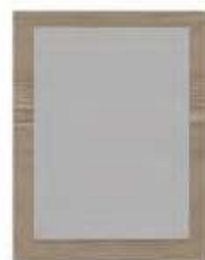
Armoire 2 portes