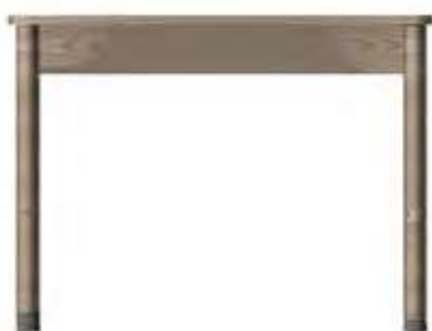
Table de chambre 4 pieds bois massif avec ceinture sous le plateau 74-0256M - 80x55x75 cm - 10 kg (non compatible avec des bridges) 74-0257M - 100x55x75 cm - 12 kg