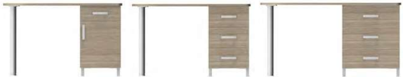
bureau-commode 120 cm 74-0485M 120x48x75 cm 49 kg