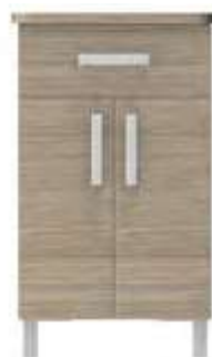
chevet 2 portes 1 tiroir 74-0183M 40x48x75 cm 30 kg