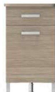
chevet 1 caisson 1 tiroir 74-0193M 40x48x75 cm 30,5 kg