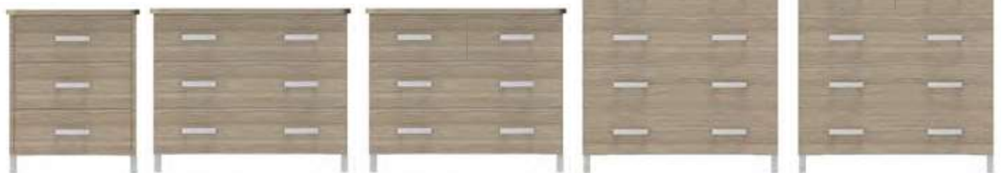
commode 60 cm 74-0383M 60x57x75 cm 49,5 kg