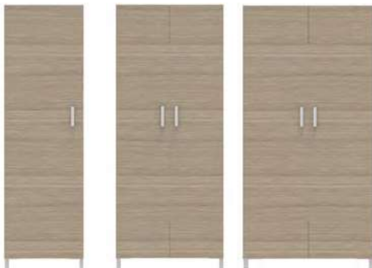
Armoire 1 porte 74-0582M 60x56x200 cm 80,5 kg