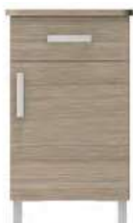
chevet 1 porte 1 tiroir 74-0182M 40x48x75 cm 28 kg