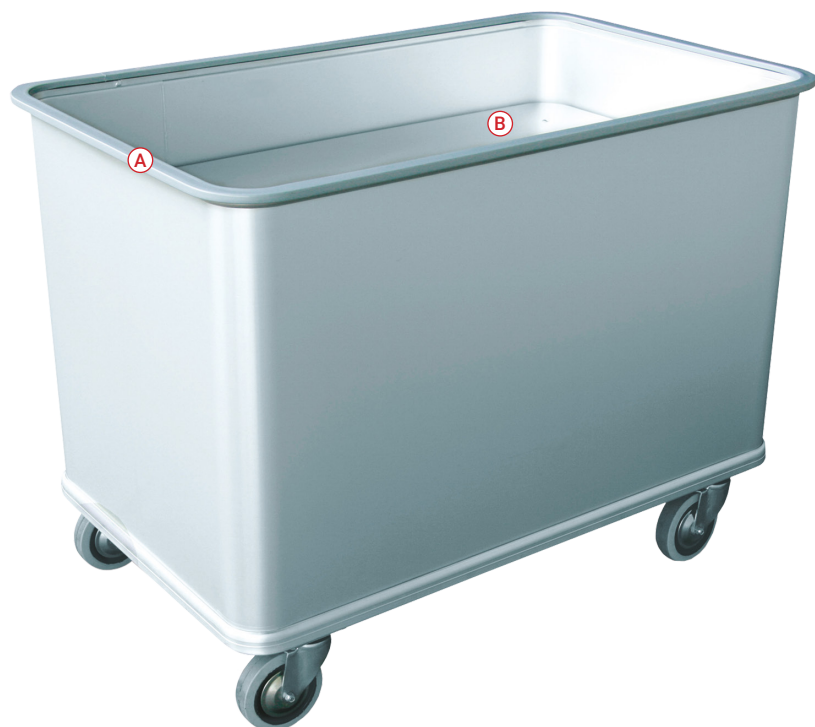
(A) Pare-chocs supérieur