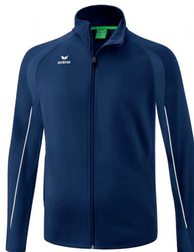
MODELE : LIGA STAR