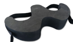
APPUI TIBIAL MOUSTACHE® Gestion du centre de gravité