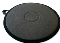
DISQUE PIVOTANT PÉDILETTE® Rotation facilitée

Pour faciliter les transferts ou encore stabiliser une verticalisation, associez la ceinture OLIVIA® avec d'autres aides techniques !