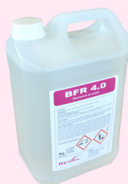
Désinfectant 5L BFR 4.0 REF : 3010.91