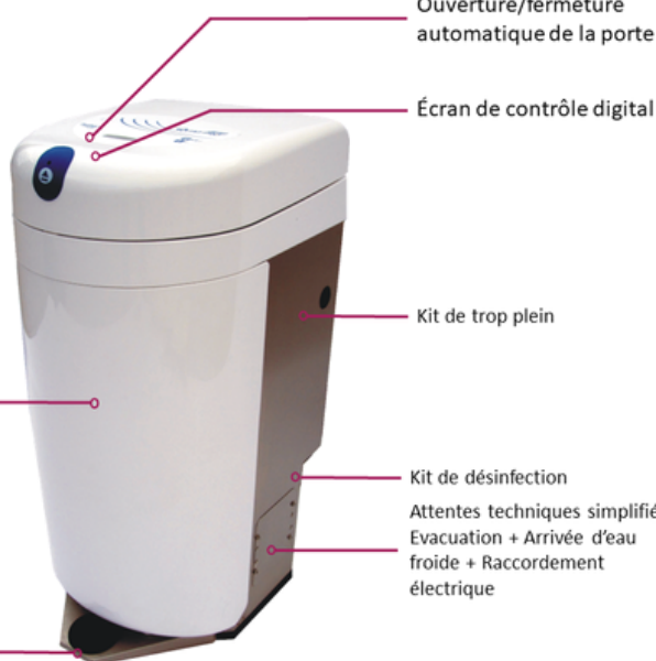
Ouverture/fermeture automatique de la porte