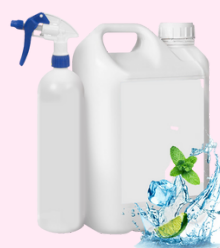
Désodorisant concentré REF : 2103.20

En savoir plus, consultez notre documentation complète accessoires et consommables pour broyeurs.