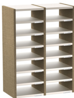
2 COLONNES H 92 CM – 14 CASES L 68 cm x P 35 cm