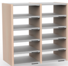
2 COLONNES H 66 CM – 10 CASES L 68 cm x P 35 cm