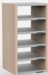
1 COLONNE H 66 CM – 5 CASES L 34 cm x P 35 cm