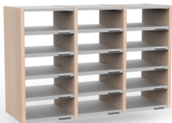
3 COLONNES H 66 CM – 15 CASES L 100 cm x P 35 cm