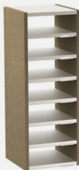
1 COLONNES H 92 CM – 7 CASES L 34 cm x P 35 cm