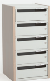
1 COLONNE H 66 CM – 5 CASES L 34 cm x P 35 cm