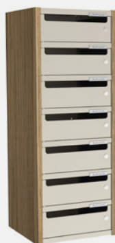
1 COLONNE H 92 CM – 7 CASES L 68 cm x P 35 cm