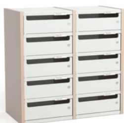
2 COLONNES H 66 CM – 10 CASES L 68 cm x P 35 cm