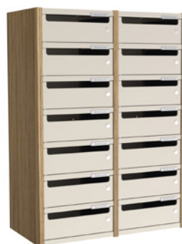
2 COLONNES H 92 CM – 14 CASES L 68 cm x P 35 cm