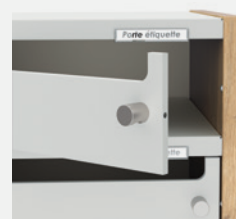
FERMETURE À ENCLIQUETAGE