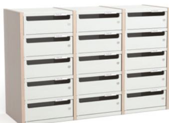
3 COLONNES H 66 CM – 15 CASES L 100 cm x P 35 cm