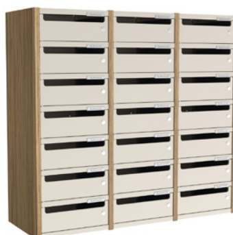
3 COLONNES H 92 CM – 21 CASES L 100 cm x P 35 cm