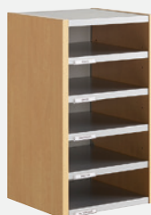
Départ H 66 cm Voir page 11 ou 12 N° 3.7 ou 3.8