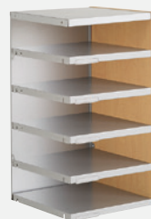
Suivant H 66 cm