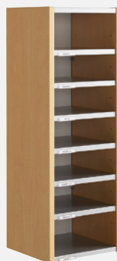
Départ H 92 cm Voir page 11 ou 12 N° 3.7 ou 3.8