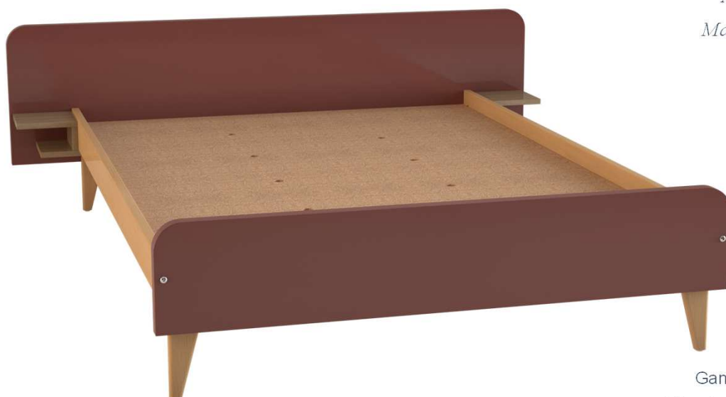
Gamme LAGUNE Visuel non contractuel