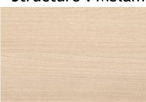
Acacia de Lakeland

Porte : Médium mélaminé selon nuancier ci-dessous et chants laqués contretypés aux décors. Structure : Mélaminé selon nuancier ci-dessous et chants ABS assortis aux décors mélaminé (sauf aménagement intérieur et dos coloris blanc craie).