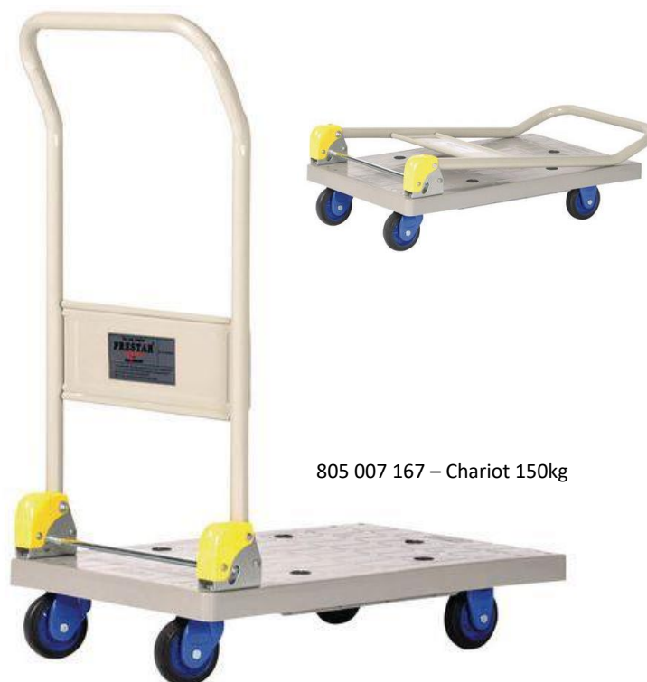
805 007 167 – Chariot 150kg