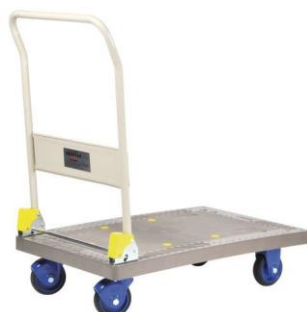
805 007 168 – Chariot 300kg