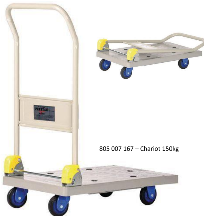
805 007 167 – Chariot 150kg