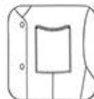
Poche poitrine avec passepoil contrasté