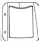
Poche basse avec passepoil contrasté