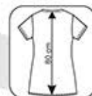
Hauteur milieu dos