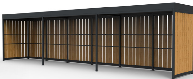
MOSAÏC haut. 2.8, 12x2m habillage planche 190x22