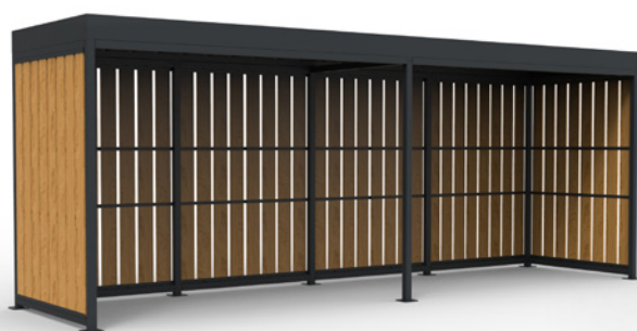
MOSAÏC haut. 2.8 8x2m ouvert habillage planche 190x22