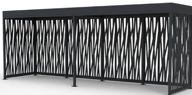
MOSAIC haut. 2.8, 8x2m, habillage motif zebra