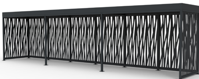
MOSAIC haut. 2.8, 12x2m, habillage motif zebra