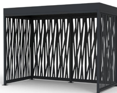
MOSAIC haut. 2.8, 4x2m, habillage motif zebra