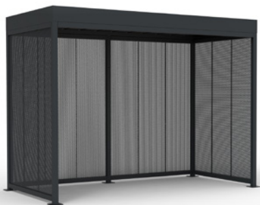
MOSAIC haut. 2.8, 4x2m, habillage tôle perforée