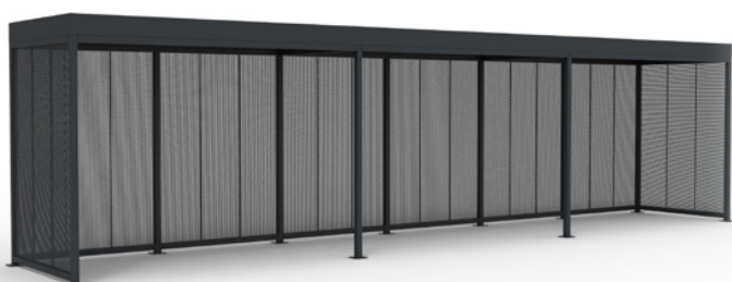
MOSAIC haut. 2.8, 12x2m, habillage tôle perforée