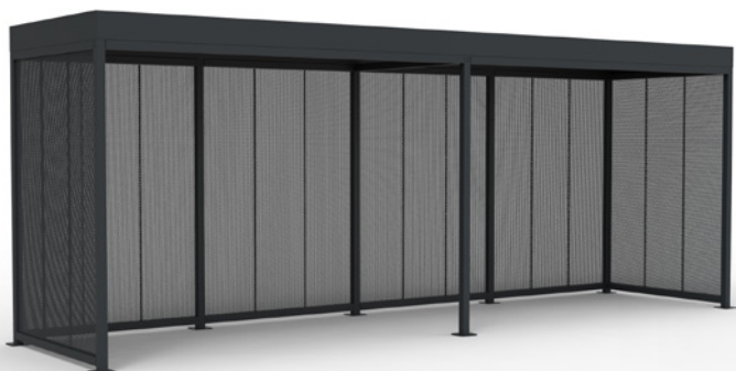
MOSAIC haut. 2.8, 8x2m, habillage tôle perforée