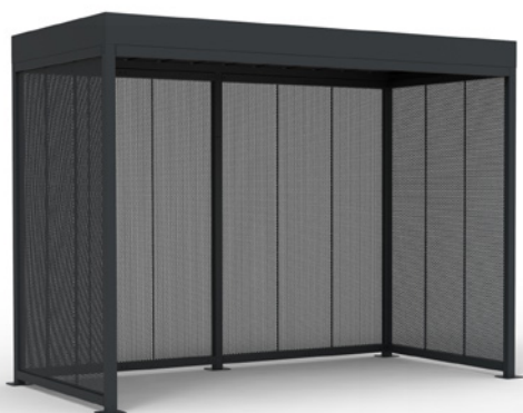
MOSAIC haut. 2.8, 4x2m, habillage tôle perforée