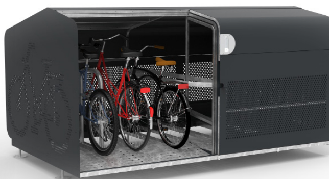
FILAO 6 PLACES