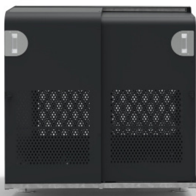
FILAO 2 PLACES