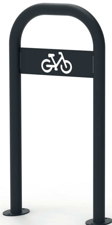
Borne A (DÉCOR)