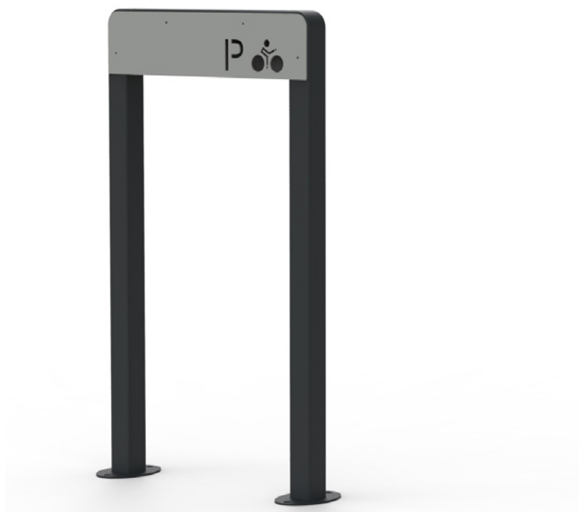
Borne NÉO (TÔLE)