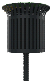
Opiton : stickers de tri