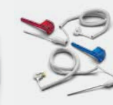
Sonde amovible et puits avec deux longueurs de câble différentes