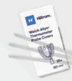
Protections de sondes souples jetables