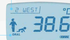
Image ou mot à sélectionner pour définir le mode du thermomètre.

Rubrique d'identification pour l'étiquetage électronique du thermomètre