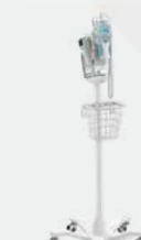
Installé sur un socle roulant