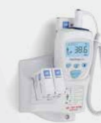
Fixation murale avec espace de rangement pour 50 couvre-sondes supplémentaires