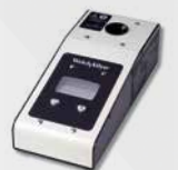
Contrôleur d'étalonnage sur site