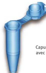
Capuchon dôme avec languettes