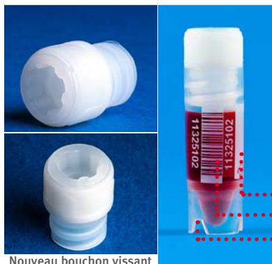
Nouveau bouchon vissant