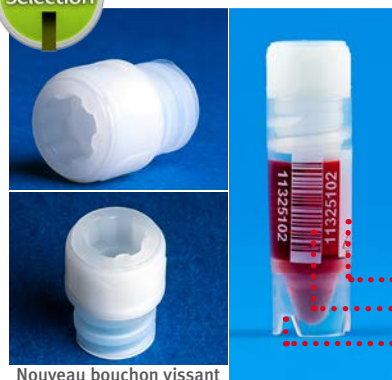
Nouveau bouchon vissant