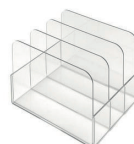
Rack 3 places