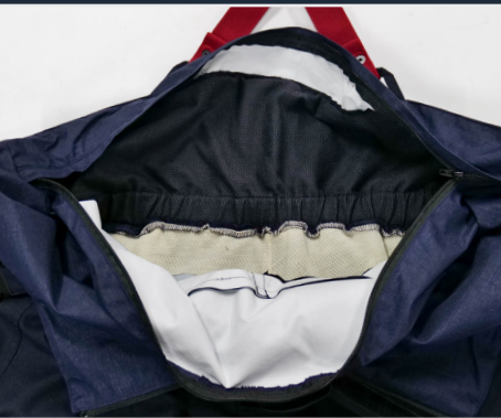
Trappe de visite