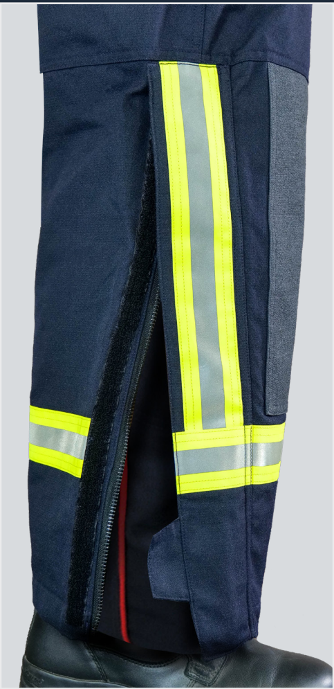
Ouverture bas de jambe Bandes rétro-réfléchissantes