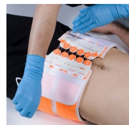
T-Pod Responder orange