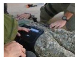
T-Pod Combat noire