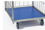
PLAQUE FOND PVC RÉF. : 372.0365