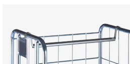
BARRE PENDERIE Amovible RÉF. : 372.098 Boulonné RÉF. : 372.536