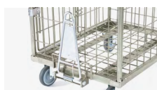
SYSTÈME D'ATTELAGE RÉF. : 372.031