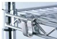
CROCHET DE LIAISON RÉF. : 374.655B TIGE DE RETENUE RÉF. : 374.671B