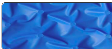
Système nid d'abeille