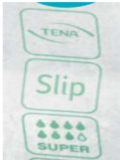
exemple ci-dessus de l'identification du voile extérieur du voile extérieur Pour ce produit, la couleur utilisée sera le GRIS