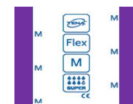
exemple ci-dessus de l'identification du voile extérieur