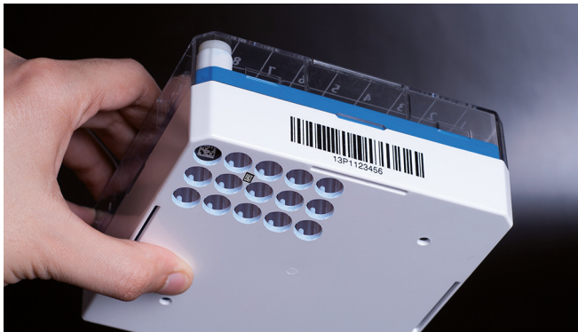
Fond des Cryogen Box 2D : code-barres 2D et ouvertures*